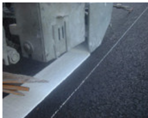
Przykład znakowania „gładkiego”