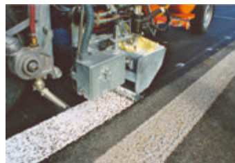
Przykład znakowania „strukturalnego”

Installation work at the customer (outside of Europe) is charged individually, separately Einbauarbeiten bei der Kunde (ausserhalb Europa) werden individuell, separat verrechnet. Prace adaptacyjne u klienta (poza Europa) będą wyceniane indywidualnie